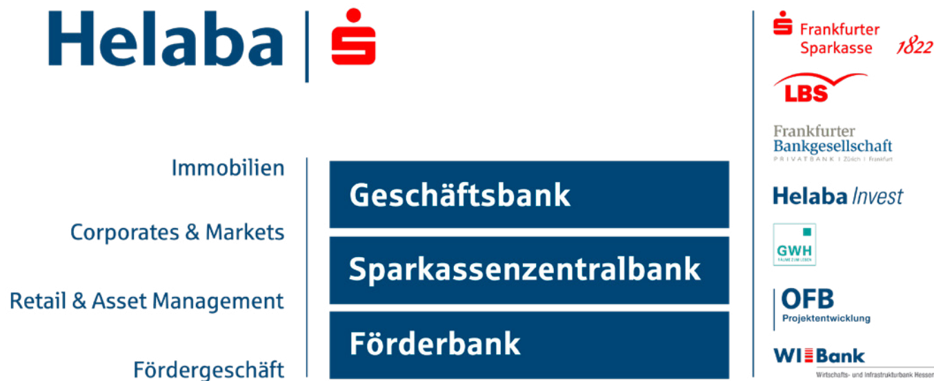
Geschäftsmodell der Helaba

Die Frankfurter Sparkasse (FSP), der regionale Marktführer im Retail Banking, ist eine 100%ige Tochter der Helaba. Zur Helaba-Gruppe gehören neben der FSP und der WIBank unter anderem auch die Direktbank 1822direkt und die Landesbau-sparkasse Hessen-Thüringen (LBS). Die Bank hat ihre Sitze in Frankfurt am Main und Erfurt und ist mit Niederlassungen in Düsseldorf und Kassel sowie Paris, London, New York und Stockholm vertreten. Durch die Niederlassungen verstärkt die Helaba ihre Nähe zu den Kunden und Sparkassen. Darüber hinaus eröffnen die ausländischen Niederlassungen der Helaba den Zugang zu den Refinanzierungsmärkten. Hinzu kommen Repräsentanzen und Vertriebsbüros sowie Tochter- und Beteiligungsgesellschaften.